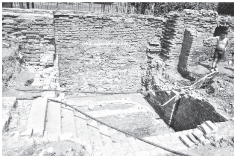
Ásatások a vár északi kapujánál