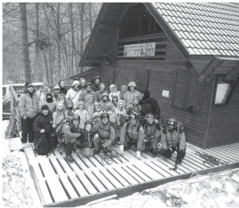
Biztonságban a csapat

A túrázók csak téli felszereléssel (síléc, hágóvas, kötél vagy lavinafelszerelés) felvértezve induljanak a hegynek, előzetesen pedig jelentésük szándékukat a Maros megyei hegyimentő szolgálat 0728-289-442-es vagy az országos Salvamont 0372-126-668-as telefonszámán. (vajda)