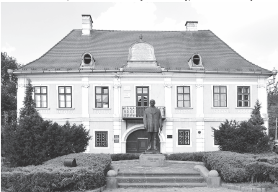
A Teleki-ház dr. Bernády György volt polgármester szobrával

A kommunista korszak erőszakos kollektivizálását és erőltetett iparosítását követően megváltozik az etnikai arány a városban. Számos gyár létrehozásával, majd a város zártta nyitásával nagy számban telepítenek be románokat, illetve kényszeredetten hagyja el a várost több magyar. Ennek ellenére az 1960–1970-es években számos kulturális intézmény alakul, illetve működik (a Székely Népi Együttes, a későbbi a Maros Művészegyüttes), az Állami Nemzeti Színház, a Filharmónia, a Bábszínház, a Marosvásárhelyi Területi Rádió (amelyet 1985-ben bezűntetnek) stb. Az 1989. decemberi forradalomban hatan veszítik életüket, közel százan megsebesülnek. 1990 március 19–20-án etnikai konfliktust robbantnak ki, amely szintén emberáldozatokkal járt. Az ezt követő két évtizedben nagyfokú kivándorlás indul meg, amelyet a nagyipari vállalatok csödbe jutása, a gazdasági instabilitás is ösztönöz, és a 2000-es évek végéig megváltozik magyar és román lakosság aránya. Az utóbbi két évtizedben szoborállításán kívül nem történt jelentősebb, a város történetében bejegyzésre méltó megvalósítás.