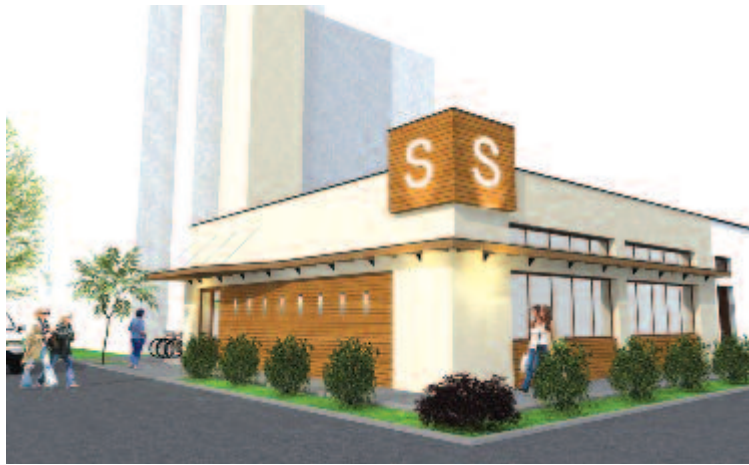
Életet lehelnek a volt kazánházba (látványterv)

„A legtöbb panasznak a szemétszállítással kapcsolatos, ezért az idén beterveztük a költségvetésbe a szeméttároló helyeket, és találtunk egy olyan megoldást, hogy mint egy szekrénybe, betaszítják a szeméttárolót, és csak egy kis nyí-