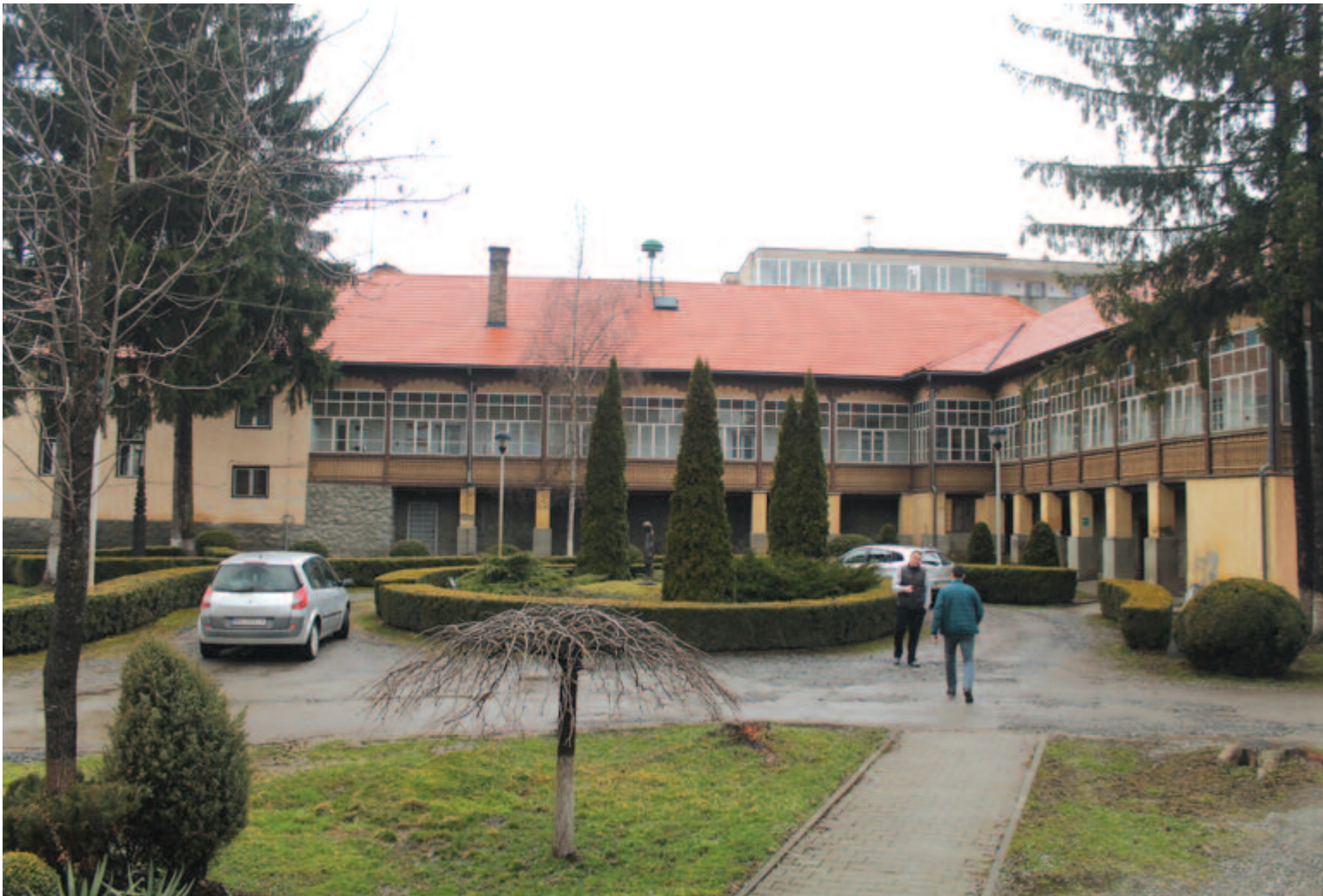
Szovátai vendégházunk a 6. oldalon